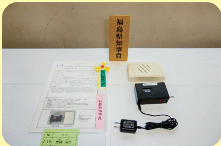
温度見張り番(一般の部 二本松市)