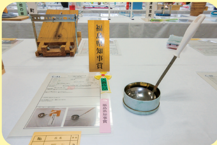
磁石おたまたて(須賀川市立西袋中学校 2年)