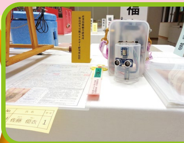
フィジカルディスタンス補助装置