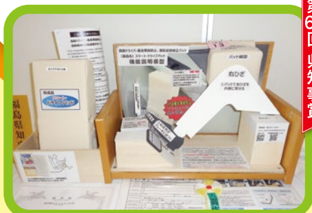
高齢ドライバー暴走事故防止、 運転姿勢矯正パッド