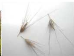
種子毛・カギ針付殻