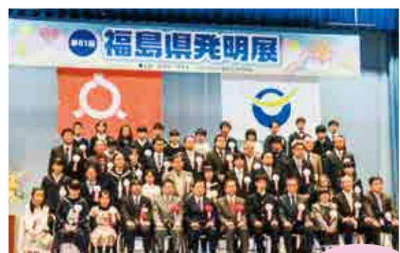
福島県発明展表彰式

福島県発明展 福島県の産業・技術の発展に資するとともに、時代を担う児童・生徒の創造性の育成を目的として開催