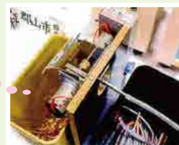
全日本学生児童発明くふう展

第67回 恩賜記念賞受賞作品 福島県立郡山北工業高等学校 「Cuツバギくん」 不要となった電線の樹脂外被を自動で剥離する装置です。