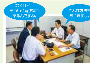
専門家による無料相談会