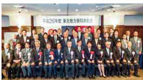
東北地方発明表彰式

全国発明表彰・東北地方発明表彰 公益社団法人発明協会と連携し、応募の斡旋などの公益事業を行っています