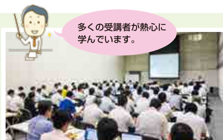
初心者向け知的財産権制度説明会